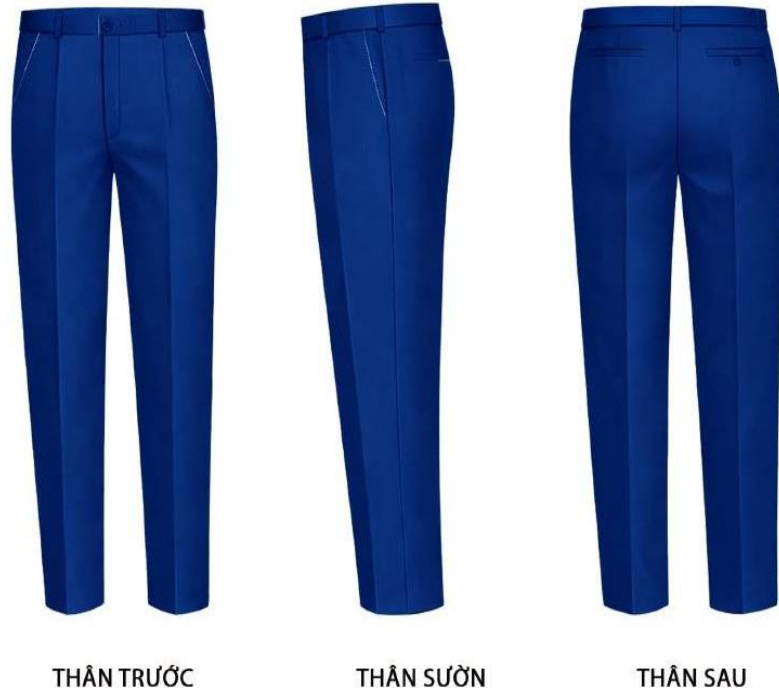
Hình 10: Quần âu cho nữ