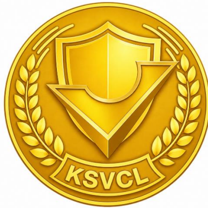
Hình 6: Cầu vai cho từng vị trí việc làm chuyên ngành kiểm soát viên chất lượng