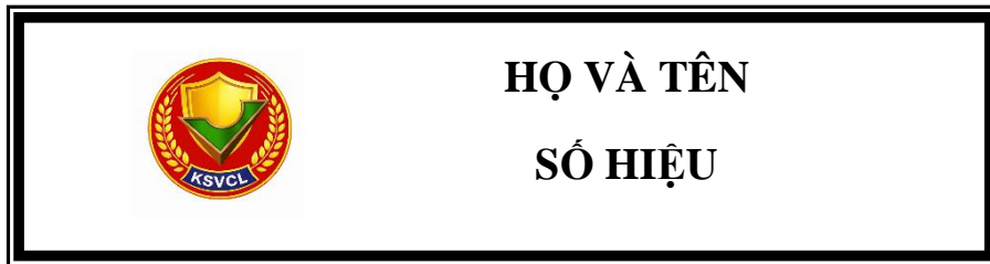
Hình 2. Thẻ kiểm soát viên chất lượng mặt trước