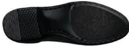
MẶT ĐÉ GIÀY