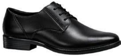
MẶT BÊN GIÀY