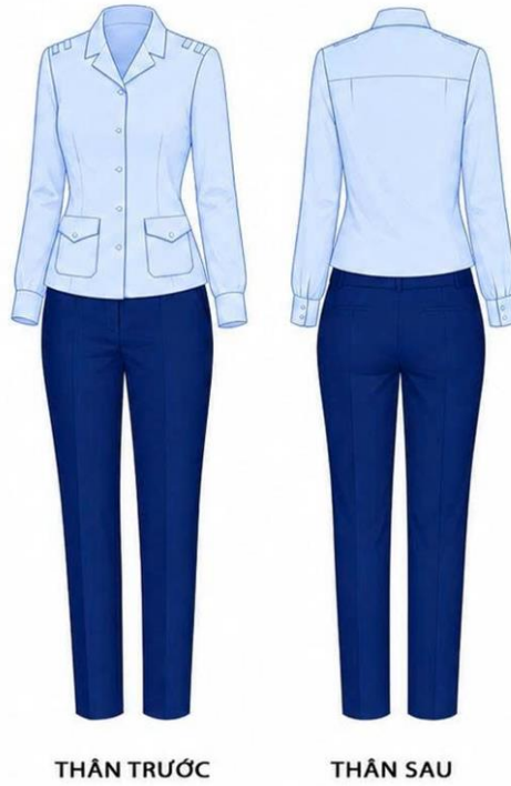
Hình 6: Áo sơ mi mặc trong áo khoác cho nữ