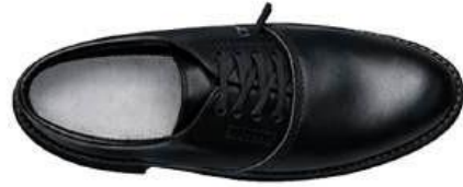
MẶT TRƯỚC GIÀY