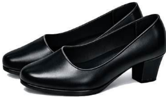
Hình 15: Giày nữ