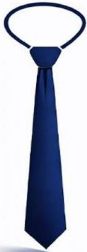
Hình 12: Cà vạt