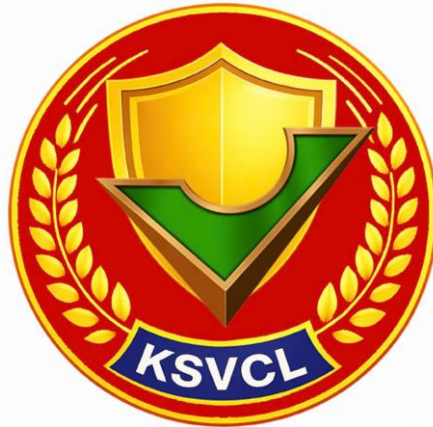
Hình 2: Phù hiệu kiểm soát viên chất lượng gắn trên mũ kê-pi