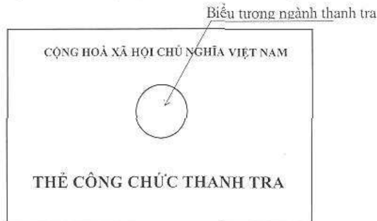
Hình 1: Mặt trước thẻ công chức thanh tra

Giữa hai dòng là biểu tượng ngành thanh tra, đường kính 24mm.